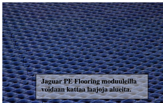
Jaguar PE Flooring moduuleilla voidaan kattaa laajoja alueita.