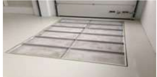
Esimerkki MH 43 Herculesin alustan valmistuksesta