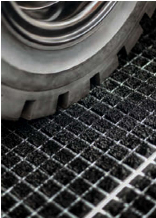
puhdistaa pyörät vähentävät onnettomuusriskiä liukkaalla ja likaisella lattialla.

MH 43 Hercules -matoista tehdyt siivousalueet ovat välttämätön lisävaruste nykyaikaisissa varastoissa, tuotantolaitosten syöttöalueilla, autokorjaamoissa, sisäänkäynneissä maanalaisiin pysäköintialueisiin. Ne luovat tehokkaasti puhdistusesteen puhtaiden ja likaisten vyöhykkeiden välille teollisuudessa ja maataloudessa.