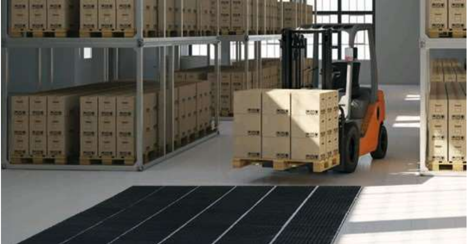
Esimerkki puhdistusalueen asentamisesta käyttämällä MH 43 Hercules harja / teräsritilää