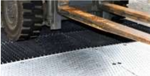
Trukit, kuorma-autot, sopii kaikille ajoneuvoille