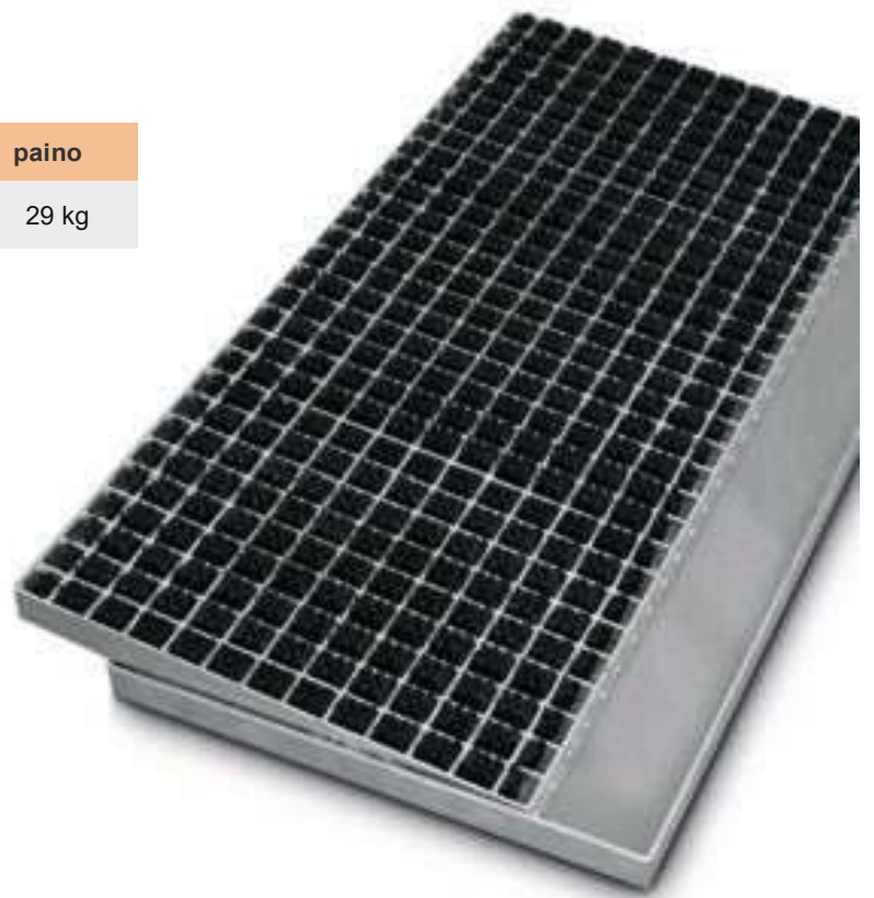
MH 43 Hercules -moduuli ja rst asennuskaukalo